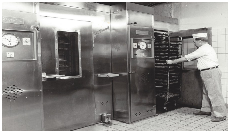
Nye ovne 1976.